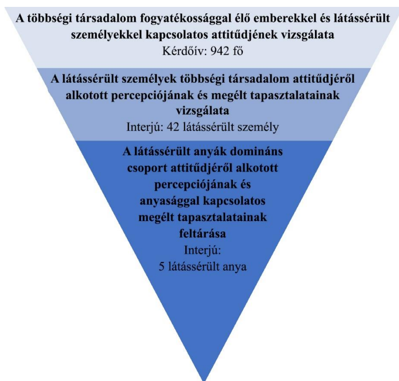
1. ábra. Kutatási tölcser

A kutatás szűkebb fókuszát a társadalmi nem és a kompetencia vizsgálata adta. Mindhárom vizsgálat során a társadalmi nemek tudománya és a fogyatékossgtudomány szerinti megközelítés dominált, amelyből következik, hogy a társadalmi nem, a nőiség és a maszkulinitás, valamint az észlelt kompetencia vizsgálata minden esetben hangsúlyos szerepet töltött be. Mindhárom vizsgálat rendelkezik az ELTE Pedagógiai és Pszichológiai Kar Kari Kutatásetikai Bizottság által kiadott kutatósetikai engedéllyel, az egyes vizsgálatok finanszírozását pedig az ELTE Doktori Pályázata biztosította.